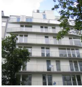
Wien 5 Fendigasse 27 NFI: 43 – 65 m 2 Fertigstellung: 06/2009 zu 95,2 % vermietet