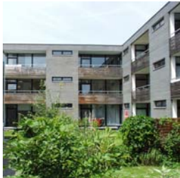
Wels Edisonstraße 11 NFI: 63 – 75 m 2 Fertigstellung: 07/1998