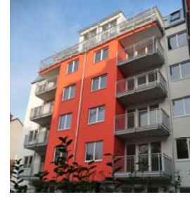
Wien 20 Wallensteinstraße 45-47 NFI: 43 – 78 m 2 Fertigstellung: 10/2008 zu 100 % vermietet