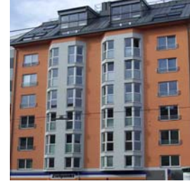
Wien 5 Wiedner Hauptstraße 118 NFI: 40 – 53 m 2 Fertigstellung: 10/2002 zu 100 % vermietet