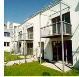
Wien 23 Maurer Lange G. 80-82 NFI: 30 – 70 m 2 Fertigstellung: 01/1999