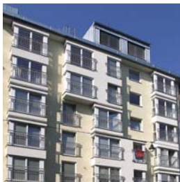
Wien 5 Kleine Neugasse 3 NFI: 43 – 63 m 2 Fertigstellung: 07/2001 zu 100 % vermietet

Nähere Informationen zu unseren aktuellen Real Invest Vorsorgewohnungen erhalten Sie am Real Invest Service Telefon: 01/331 71 – 9000.