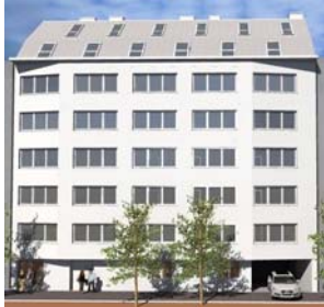
Wien 3 Petrusgasse 1A NFI: 40 – 70 m 2 In Bau - geplante Fertigstellung 4. Qu. 2010

Realisierte Real Invest Vorsorgewohnungsprojekte (Vermietungsgrad April 2010):