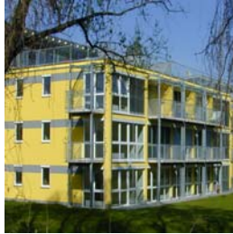
Graz – Ragnitz Ragnitzstraße 62 NFI: 35 – 46 m 2 Fertigstellung: 09/1999 bzw. 05/2000