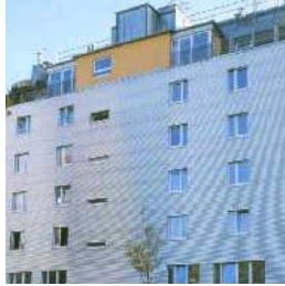
Wien 20 Leipziger Straße 58 NFI: 36 – 65 m 2 Fertigstellung: 06/1998

Nähere Informationen zu unseren aktuellen Real Invest Vorsorgewohnungen erhalten Sie am Real Invest Service Telefon: 01/331 71 – 9000.