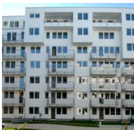
Wien 7 Seidengasse 3-7 NFI: 45 – 81 m 2 Fertigstellung: 10/2006 zu 100 % vermietet