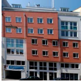
Wien 7 Kaiserstraße 63 NFI: 40 – 61 m 2 Fertigstellung: 04/2005 zu 91,4 % vermietet