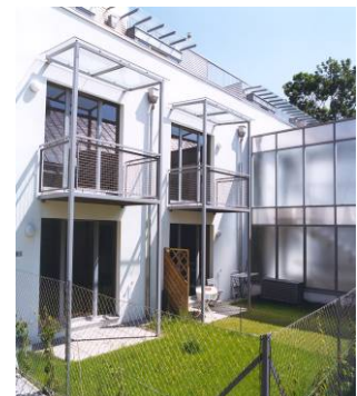
Maurer Lange Gasse, Wien