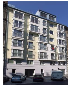
Kleine Neugasse, Wien